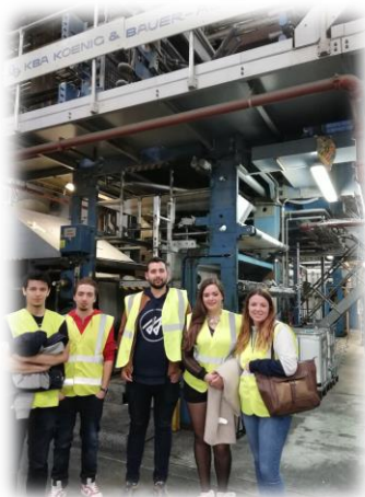
Visite de la SIB par les étudiant. Imprimerie située sur le secteur de Saint Léonard