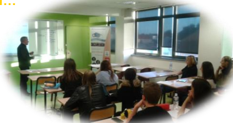
Les étudiants au Grand Rex à Paris !

Intervenant extérieur d'un responsable communication sur la thématique "Création d'un flyer".