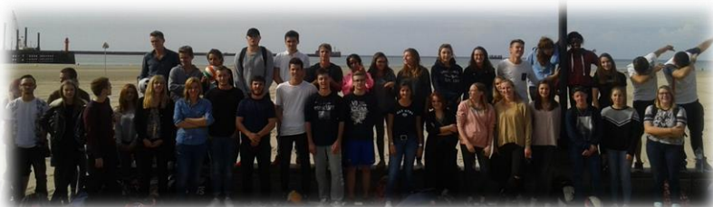
Journée intégration et parrainage sur la plage de Boulogne-sur-Mer. Tournois sportifs !